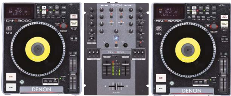
DN-S3000 + DN-X300 + DN-S3000