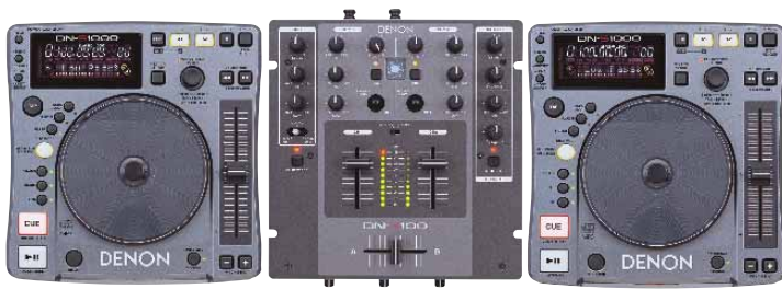
DN-S1000 + DN-X100 + DN-S1000