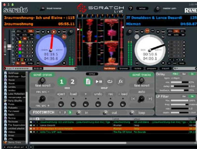
Serato Scratch LIVE Software 1,6 Screenshot